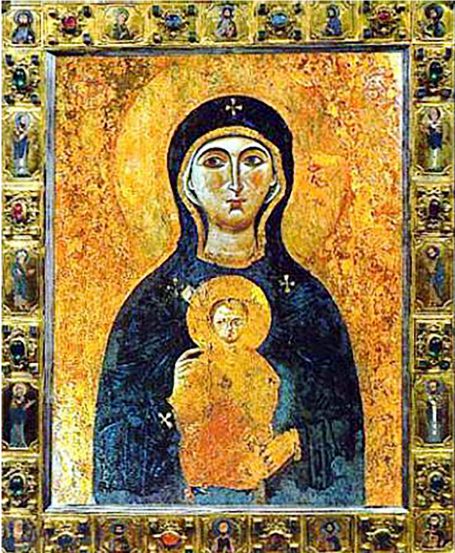
Fig. 11: Icona della Madonna Nicopeia conservata nella omonima cappella della Basilica di San Marco a Venezia.