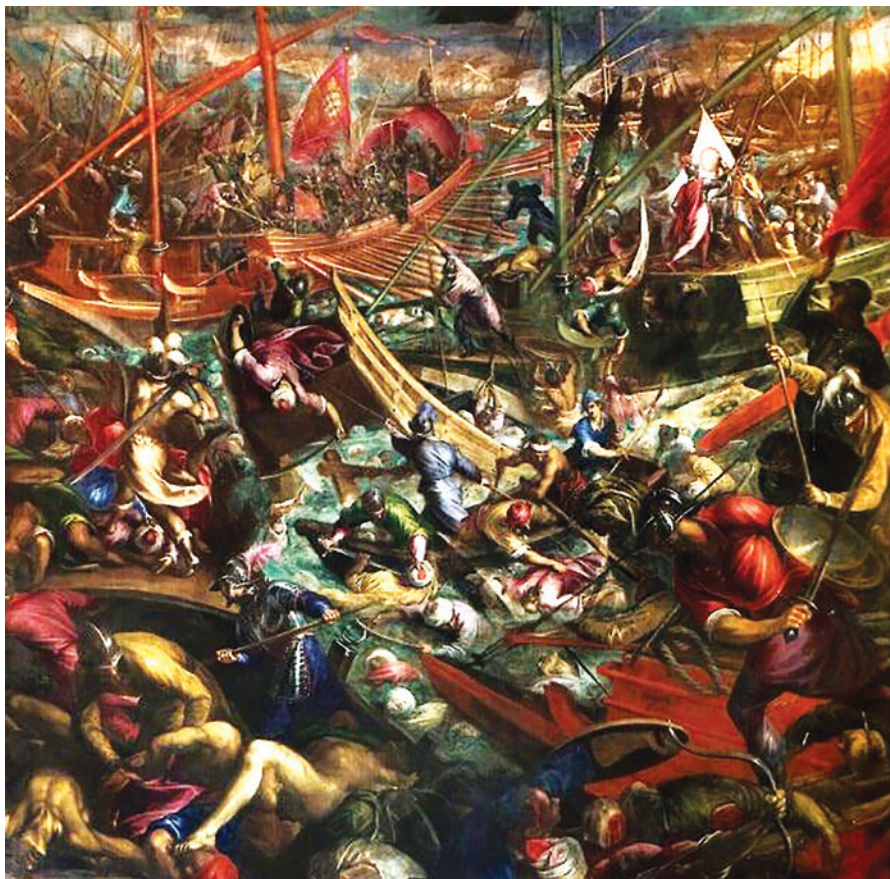
Fig. 10: Assalto e prima presa di Costantinopoli - Jacopo Palma il Giovane, Sala del Maggior Consiglio, Palazzo Ducale, Venezia.

Nell'attacco frontale, le galere veneziane si accostano e il doge scende per primo sulla riva, seguito dagli ufficiali e dai portatori del gonfalone, spingendo tutti i suoi a lanciarsi nella mischia, superando le reticenze e l'iniziale timore. I crociati occupano le torri, aprono brecce nella cinta e da lì la conquista della città diventa inevitabile.