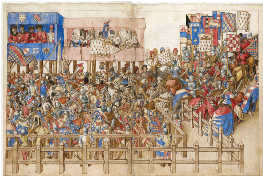
Fig. 1: Miniatura di un torneo medievale ( Enluminure du Livre des tournois du Roi René d'Anjou 1430 ).

Il reclutamento dei crociati ebbe come centro nevralgico il torneo di Ecry 25 del 28 novembre 1199. Al “turneamant”, che era stato bandito da Tebaldo di Champagne 26 , presero parte molti giovani nobili francesi e dei paesi limitrofi. Queste finte guerre, che duravano alcuni giorni ed erano combattute dai giovani dei maggiori casati europei, erano rigorosamente vietate dalla Chiesa 27 , ma proprio per questo si prestavano a essere le sedi ideali della predicazione e del proselitismo religioso. Al torneo di Ecry andò anche Folco di Neuille, il quale poté – facendo leva sulla scelleratezza di quei giovani che sprecavano le loro migliori energie in giochi vietati e pericolosi, dove correvano gravi e inutili rischi mentre il sepolcro di Cristo era calpestato dagli infedeli – far opera di predicazione e al tempo stesso attrarre verso l’idea di Crociata un numero consistente di partecipanti.