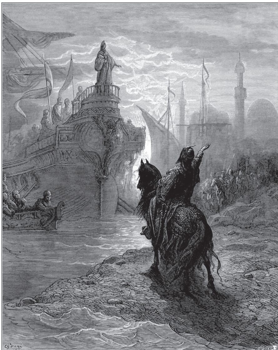
Fig. 12: Enrico Dandolo tratta con Alessio V Dukas detto Murzuflo (Michaud Joseph Francois, Storia delle crociate . Adorna di cento grandi composizioni di Gustavo Doré. Milano, Edoardo Sonzogno Editore, 1878).