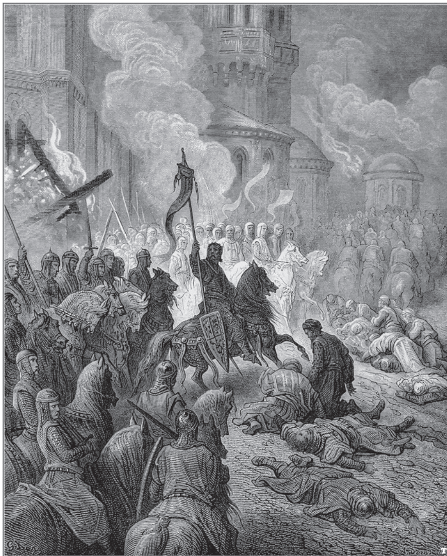
Fig. 14: L'entrata dei crociati a Costantinopoli (Michaud Joseph Francois, Storia delle crociate. Adorna di cento grandi composizioni di Gustavo Doré. Milano, Edoardo Sonzogno Editore, 1878).