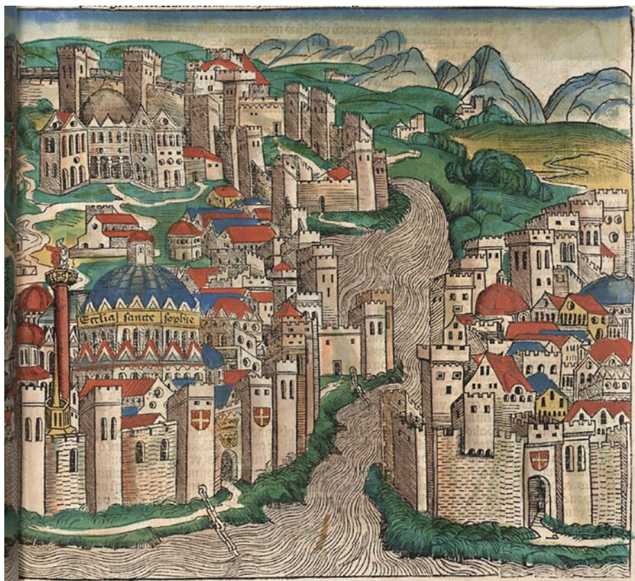
Fig. 8: Catena della Torre di Galata (Hartmann Schedel e Michael Wolgemut, Registrum huius operis libri cronicarum cum figuris et ymagibus ab inicio mundi, 1493).

La mattina seguente gli uomini della torre fecero una sortita, aiutati da rinforzi arrivati da Costantinopoli su alcune barche. Si combatté duramente, ma la torre fu presa e la catena spezzata. Così la flotta poté entrare nel porto di Costantinopoli.