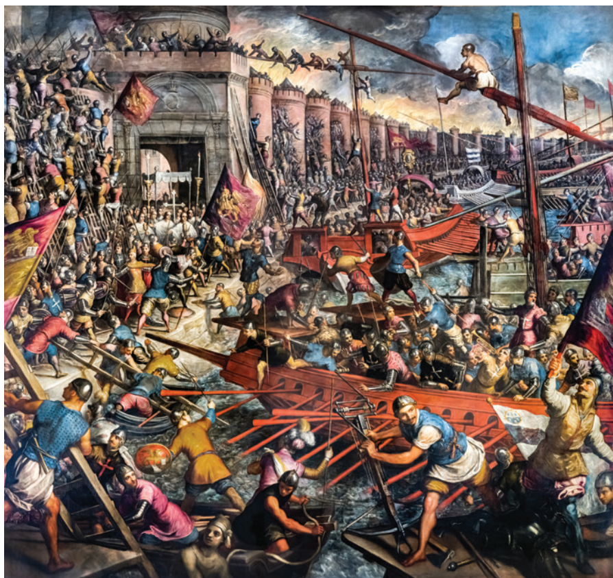
Fig. 13: Caduta o seconda presa di Costantinopoli (Domenico Tintoretto, 1598-1605, Sala del Maggior Consiglio, Palazzo Ducale, Venezia).

243. Quando i cavalieri che si trovavano sugli uscieri videro ciò, scesero a terra, rizzarono le scale ai piedi delle mura e salirono con la forza sulle mura; e conquistarono quattro torri. Allora cominciarono a balzare fuori dalle navi, dagli uscieri e dalle galee, chi prima arrivava, meglio arrivava. Spezzarono tre porte ed entrarono dentro; e cominciarono a trarre i cavalli dagli uscieri. I cavalieri montarono a cavallo e cavalcarono direttamente verso l'alloggio dell'Imperatore Murzuflo. Egli aveva disposto le sue schiere davanti alle tende; ma quando videro giungere i cavalieri a cavallo, si sbandarono, e l'Imperatore fuggì per le strade verso il castello di Boukoleon.