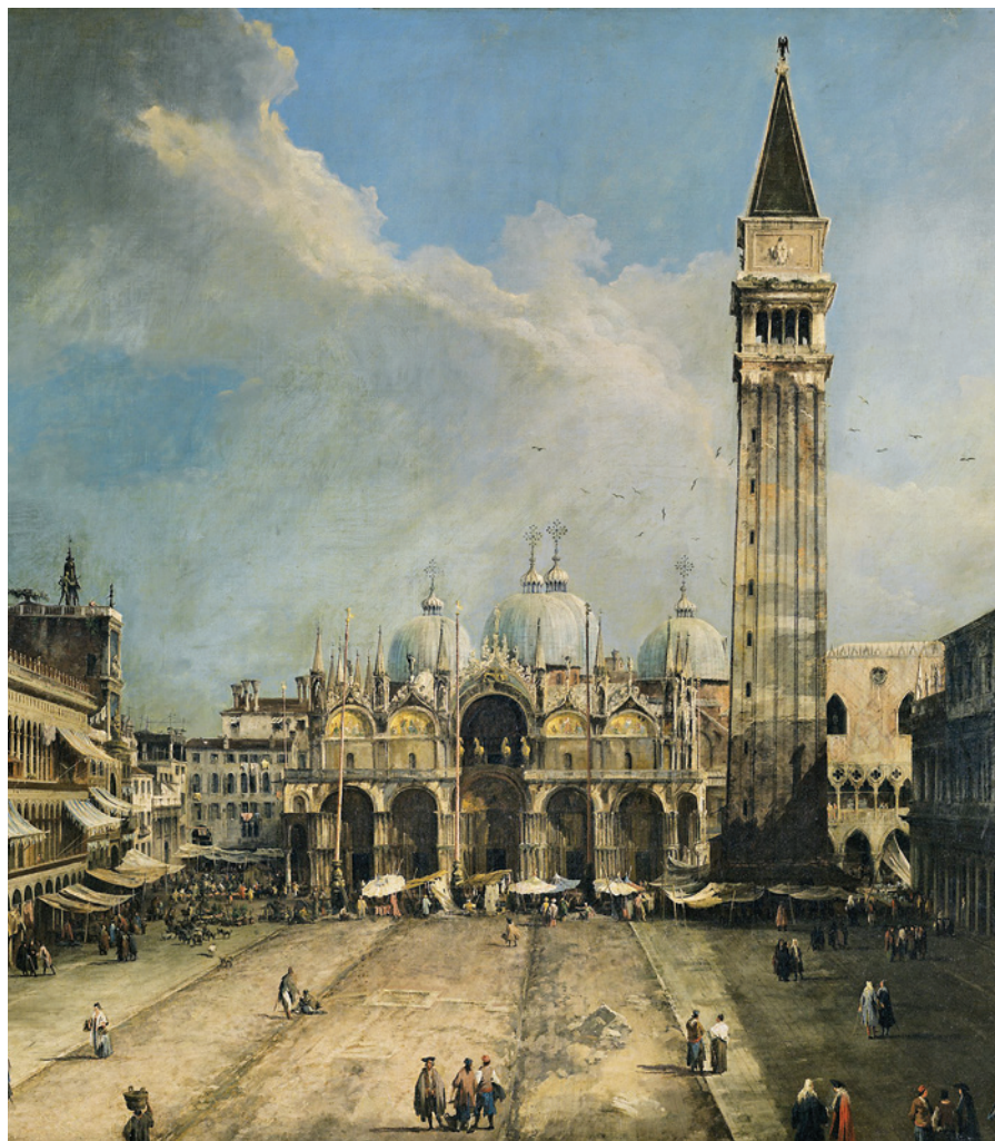
Fig. 15: I celebri quattro cavalli sopra l'ingresso della Basilica di San Marco (Canaletto, Piazza San Marco verso la Basilica, 1723. Museo Thyssen-Bornemisza, Madrid).

quello Imperio, che la Republica ha poi acquistato in terra ferma, & ornamento singolare del luogo, dove sono posti 159 .