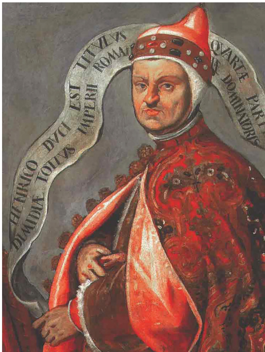
Fig. 16: Henrico duci est titulus quartae partis dimidiae totius imperii Romaniae dominatoris (Enrico Dandolo Signore di un quarto e mezzo di tutto l'Impero Romano), 1107-1205, Doge di Venezia dal 1192 al 1205.