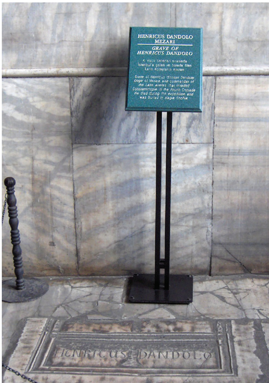
Fig. 17: Lapide tombale di Enrico Dandolo a Santa Sofia.