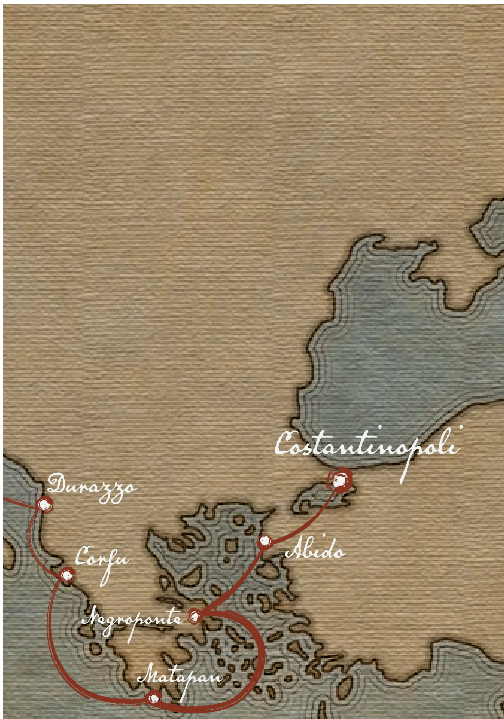
Fig. 18: Percorso dei Pellegrini durante la Quarta Crociata.