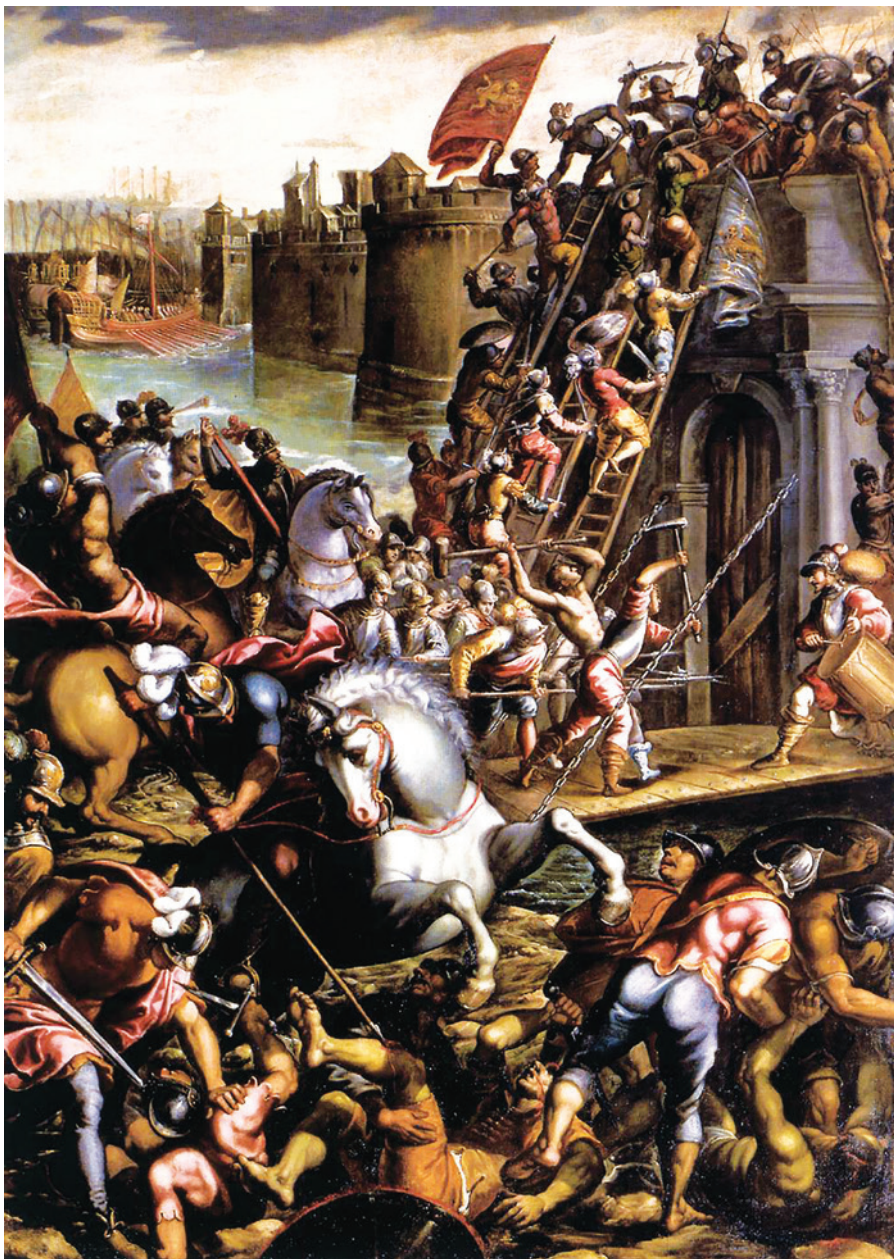
Fig. 5: I veneziani assieme ai francesi assaltano Zara (Andrea Vicentino 1617, Sala del Maggior Consiglio, Palazzo Ducale, Venezia).