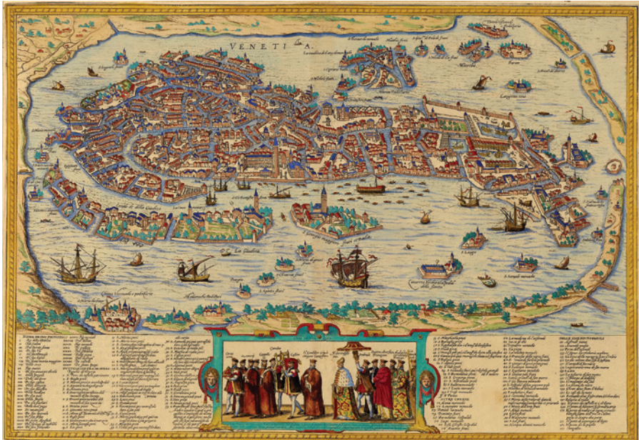
Fig. 3: Mappa di Venezia del 1572 di Franz Hogenberg.

distava una lega da Venezia. Là si trasferirono i pellegrini, piantarono le tende e si sistemarono nel miglior modo possibile.