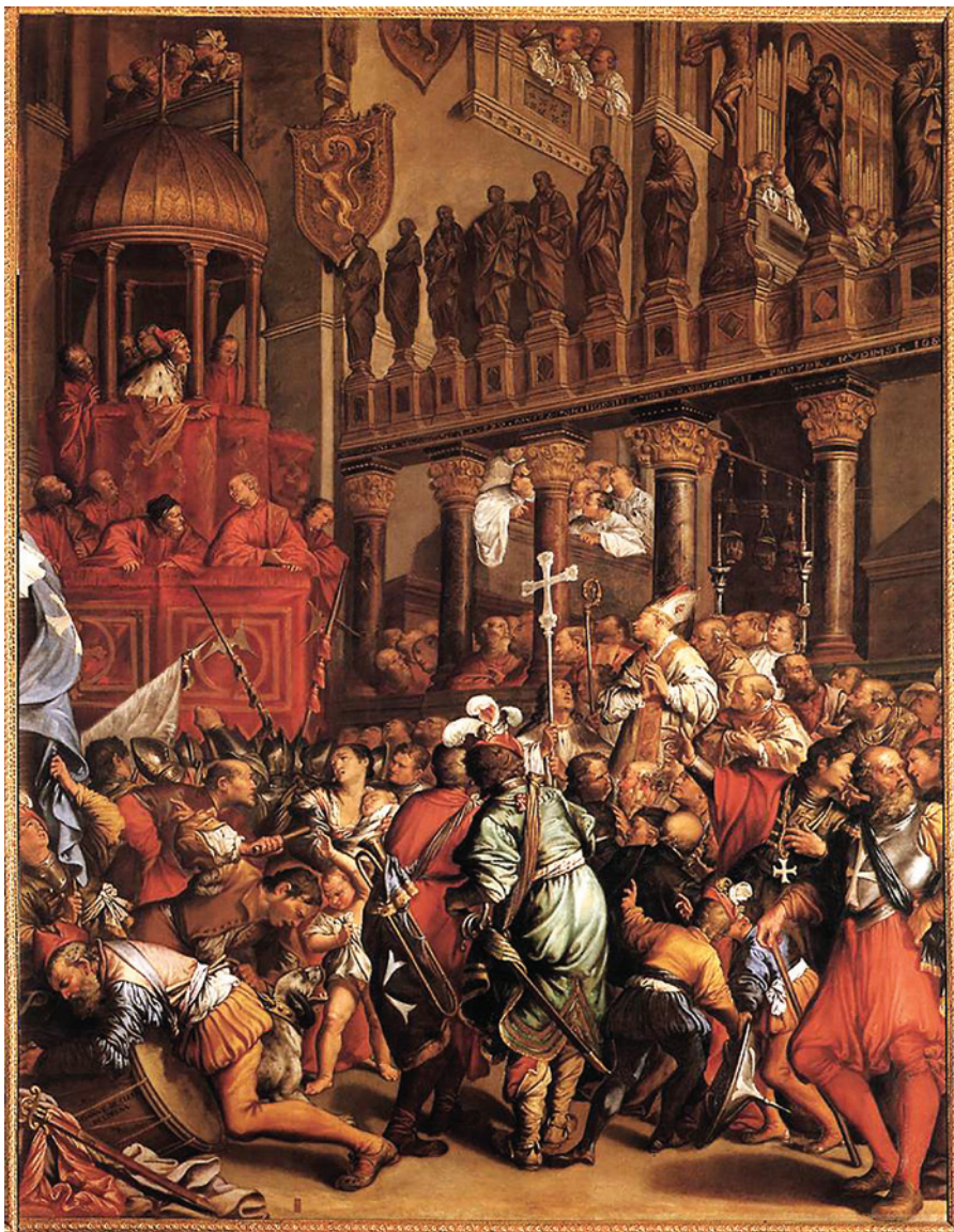
Fig. 4: Il doge Enrico Dandolo e i messaggeri francesi in S. Marco (Carlo Saraceni e Jean Le Clerc 1621, Sala del Maggior Consiglio, Palazzo Ducale, Venezia).