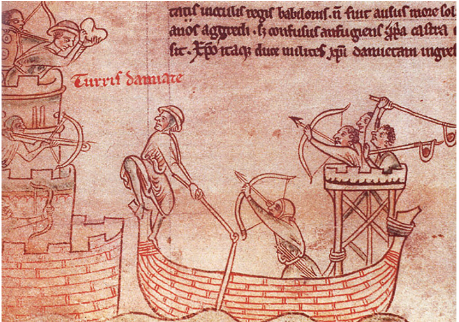
Fig. 9: Assalto delle mura con le piattaforme create sulle navi (Matthew Paris, Historia Major , c. 1219 (Ms 16 Roll 178)).

L'assalto via terra era fallito. Ma dal versante marittimo, i veneziani stavano per compiere un'impresa che sarebbe entrata nella leggenda.